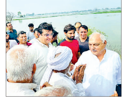
महम। जलभराव से प्रभावित इलाके में पीड़ित किसानों से बातचीत करते पूर्व सीएम भूपेंद्र सिंह हुड्डा।

मैगी सुरजन गांव की पानी निकासी के लिए बनाई गई 31 सदस्यीय कमेटी ने भी मुख्यमंत्री नायब सिंह सैनी से मुलाकात की और ड्रेन बनवाने और जल निकासी की मांग की।