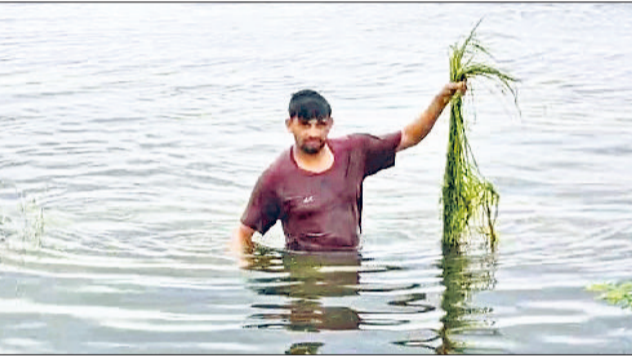
395 पम्प सेट लगाए गए हैं।

फसल नुकसान दर्ज करवाने के लिए अभी तक जिले के 61 गांव के ही पोर्टल सरकार ने खोले थे। लेकिन रविवार ने एक अहम निर्णय सरकार लिया। जिसके तहत जिले के सभी 147 गांव के पोर्टल ओपन कर दिए गए। किसान 15 सितंबर तक उनकी फसलों में हुए नुकसान को दर्ज करवा सकते हैं। रविवार शाम तक 127 गांव के 9767 किसानों ने सरकार को बताया था कि उनकी 66 हजार एकड़ की फसल ज्यादा बरसात होने की वजह से खराब हो गई है। प्रशासन का दावा है कि बारिश से कृषि भूमि में हुए जल भरवाव की निकासी का कार्य युद्ध स्तर पर जारी है। कृषि भूमि से जल निकासी के लिए