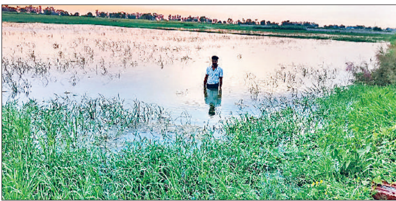
भारी बरसात से भगवतीपुर के खेतों में पानी भरने से फसल बिल्कुल खत्म हो चुकी है।

वर्ष 1996 में भी 666.50 एमएम हुई थी बरसात