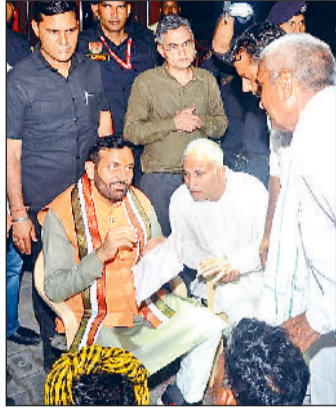
हरिभूमि न्यूज महम

ग्रामीणों की समस्याएं सुनी अविलंब निदान के निर्देश दिए