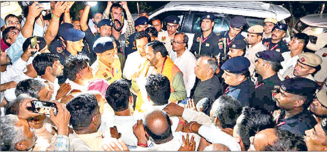
रोहतक। ग्रामीणों की शिकायत सुनते मुख्यमंत्री नायब सिंह सैनी।

सीएम नायब सिंह सैनी ने कहा यह बहुत बड़ी प्राकृतिक आपदा है, जिसमें पंजाब और हिमाचल में गांव के गांव तबाह हो गए। उन्होंने कहा कि ड्रेन ओवरफ्लो चल रही है। हर स्थिति पर सरकार की नजर है। पानी निकासी के लिए हर संभव प्रयास किए जा रहे हैं।