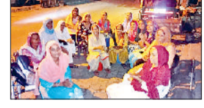
रोहतक। चंद्र ग्रहण पर डेहरी मोहल्ले में भजन गायी महिलाएं।