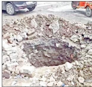
कालोनी में काले और गंदे पानी की सप्लाई की जा रही है। जिसके सेवन से लोग बीमार पड़ गए हैं। कई बार