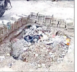
जनस्वास्थ्य विभाग के अधिकारियों को अवगत करवाने के बाद भी समस्याओं का समाधान नहीं हो रहा। अधिकारी

कार्य के प्रति गम्भीर नहीं हैं। पिछले एक माह से शांत मै चोक के पास किल्ला मोहल्ले में बिल्कुल भी पानी नहीं आ रहा। किल्ले मोहल्ले में पानी की पाईप लाईन डाली जा रही है। पिछले 40 दिनों से जनस्वास्थ्य विभाग के अधिकारी और ठेकेदार की मिलीभगत जनता के पैसे की बर्बादी हो रही है। जन स्वास्थ्य विभाग द्वारा 45 दिन में केवल गड्डे ही खुदवाए गए हैं। (समस्या का समाधान नहीं हो पा रहा। उन्होंने उपायुक्त से कार्रवाई की मांग की है।