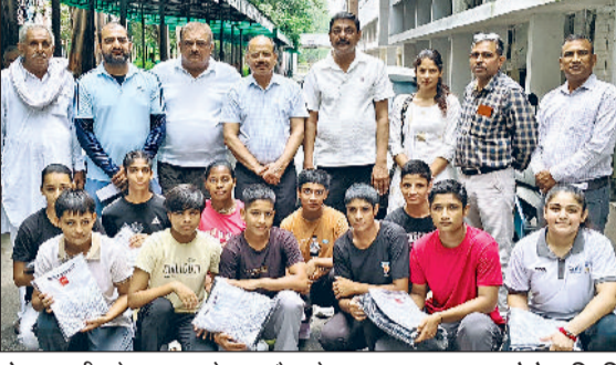
रोहतक। टीम के साथ आयोजक और कोच।

प्रतियोगिता में जिले से लगभग 320 खिलाड़ी भाग लेंगे, राज्य स्तरीय प्रतियोगिताएं 8 से 10 सितंबर तक विभिन्न जिलों में आयोजित होंगी और प्रत्येक खेल अपने-अपने निर्धारित जिला मुख्यालय पर सम्पन्न होंगे, रोहतक की टीमों ने जीत के लिए की है शानदार तैयारी