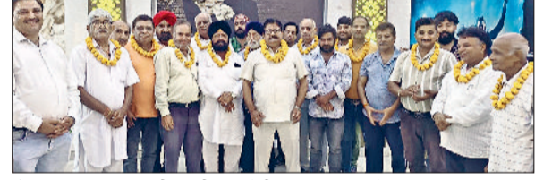
रोहतक। उपनिर्वाचित श्रीरामलीला कमेटी का स्वागत करते सदस्य।